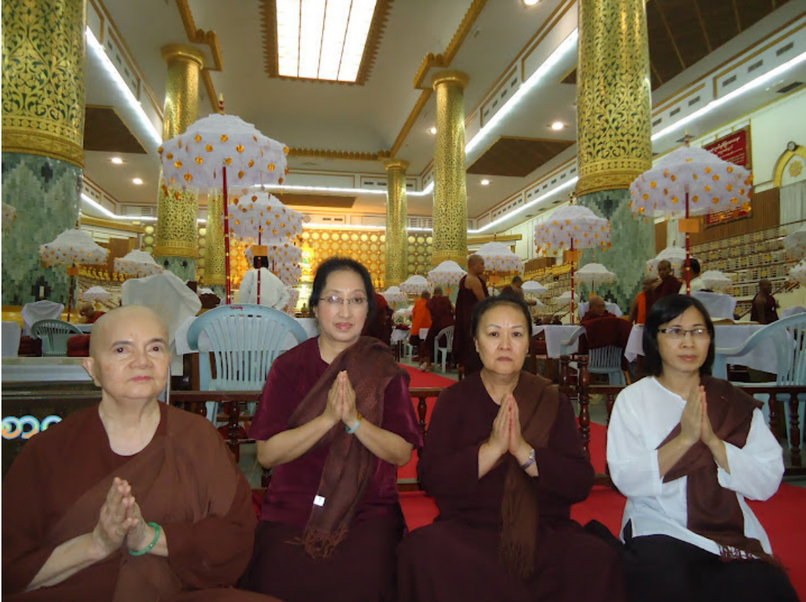
TÁC GIẢ NAGĀDĪPA MAHĀ THERA